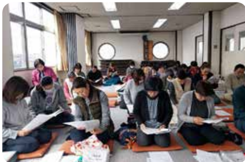
執行部役員と新旧組長とによる総会。

町内会のホームページはこちら → http://daigo1.info/index2.html