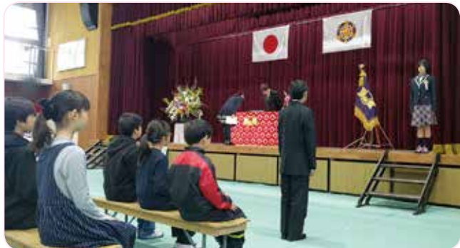
3月22日(木) 午前9時30分より、池田東小学校での卒業証書授与式。