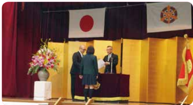
3月15日(木) 午前9時30分より、栗陵中学校での卒業証書授与式。