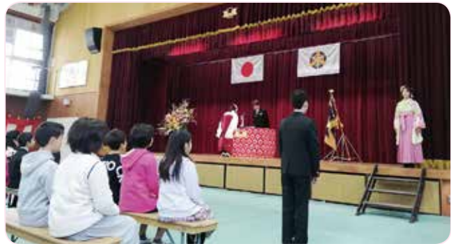
3月20日(水) 午前9時30分より、池田東小学校での卒業証書授与式。