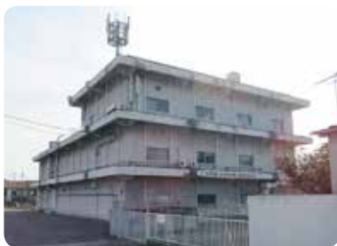
携帯電話のアンテナがたつ醍醐電話局

一九八五年一昭和六〇一、電電公社が民営化されてNTTになる前から、町内の北東に、醍醐電話局(NTT西日本京都支店醍醐別館)がある。一九五二年一昭和二七、電電公社が設立されてからできたのだろう。醍醐の電話番号は五七一ではじまる。ちなみに五七一〇〇〇一は醍醐小学校、〇〇〇二は醍醐寺三宝院、〇〇〇三が醍醐支所である。町内でも五七一ではじまる電話番号をお持ちなのは、早くから醍醐に住んでおられるお宅である。(T)