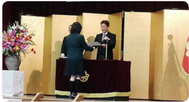
3月15日(金) 午前9時30分より、栗陵中学校での卒業証書授与式。