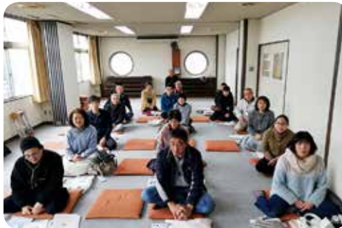
新組長のみなさんです。よろしくお願ひします。

町内会のホームページはこちら → http://daigo1.info/index2.html